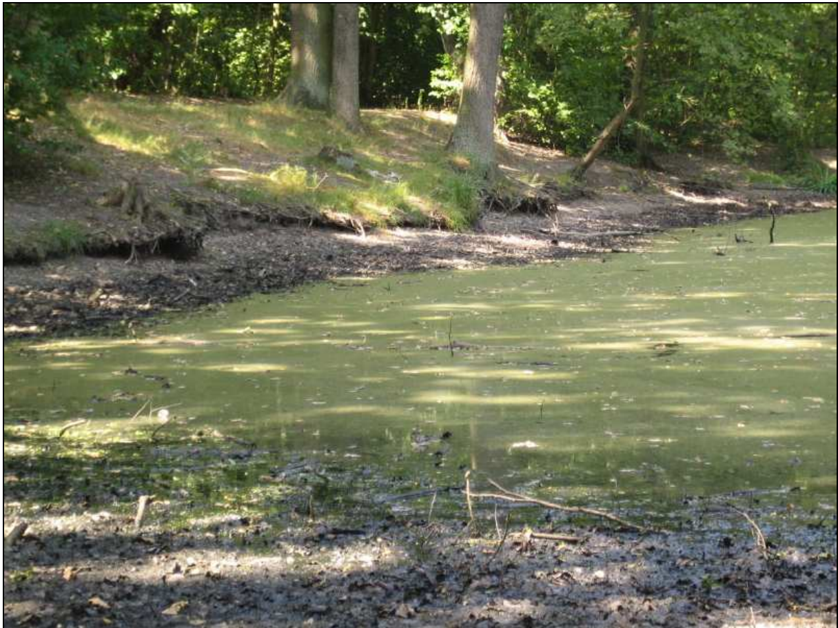
Abbildung 3: Schlamm und Laubstreu werden bei niedrigem Wasserstand sichtbar (Juli 2010)

wohner mit einer starken Geruchsbelästigung verbunden, denen dann z. T. der Aufenthalt im Garten bzw. das Öffnen der Fenster nicht mehr möglich ist.