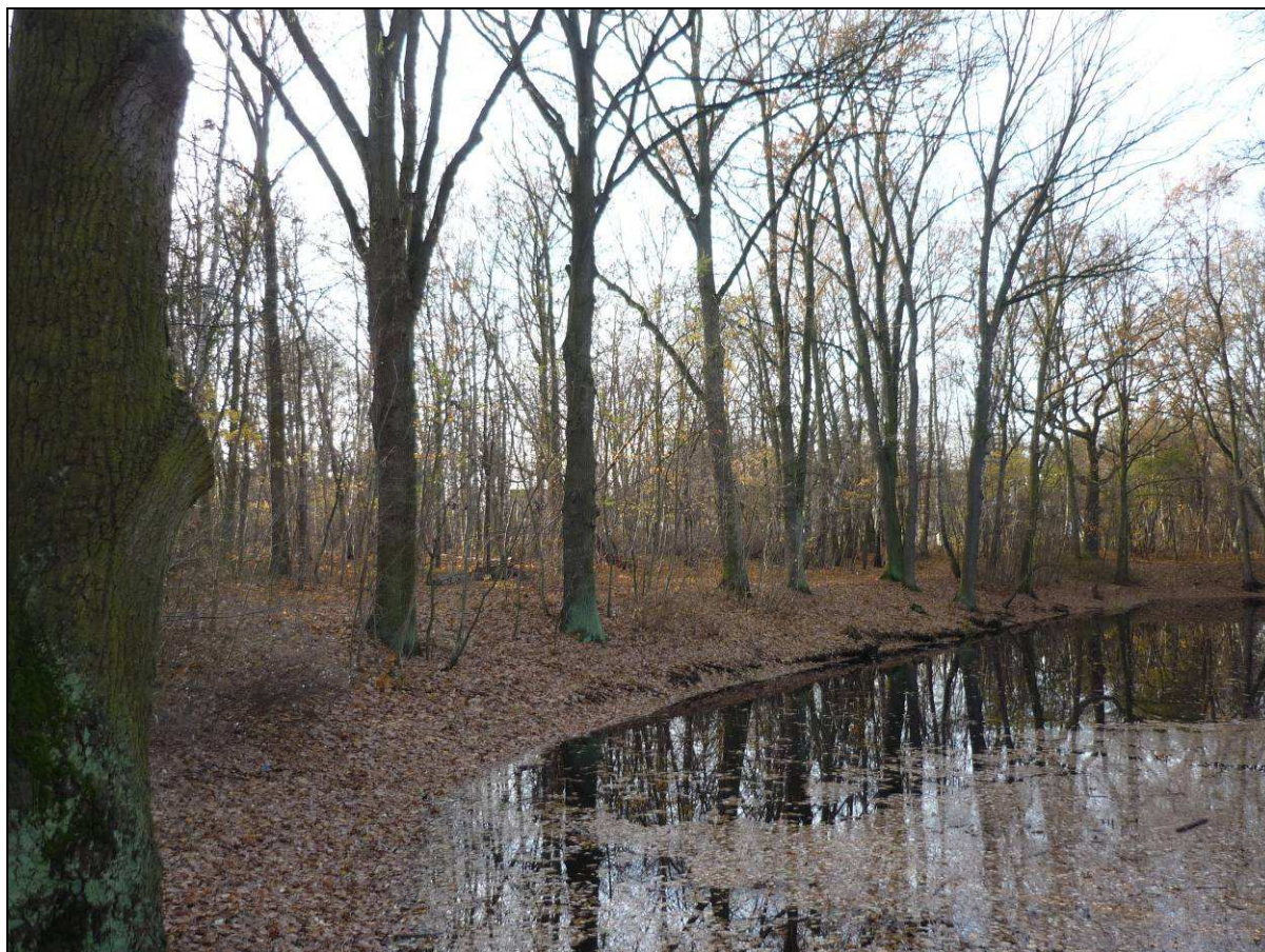
Abbildung 4: Blick auf das Südwestufer mit den zu fällenden Eichen

Zusätzlich sollen im Zuge der Renaturierungsarbeiten beide Regenwasserausläufe in den Pfuhl jeweils mit einer nachgeschalteten Sedimentationsanlage versehen werden. Diese dient dazu grobe Schmutzpartikel sowie leicht schwimmende Stoffe und Leichtflüssigkeiten zurückzuhalten, die zu einer Beeinträchtigung der Gewässerqualität führen können.