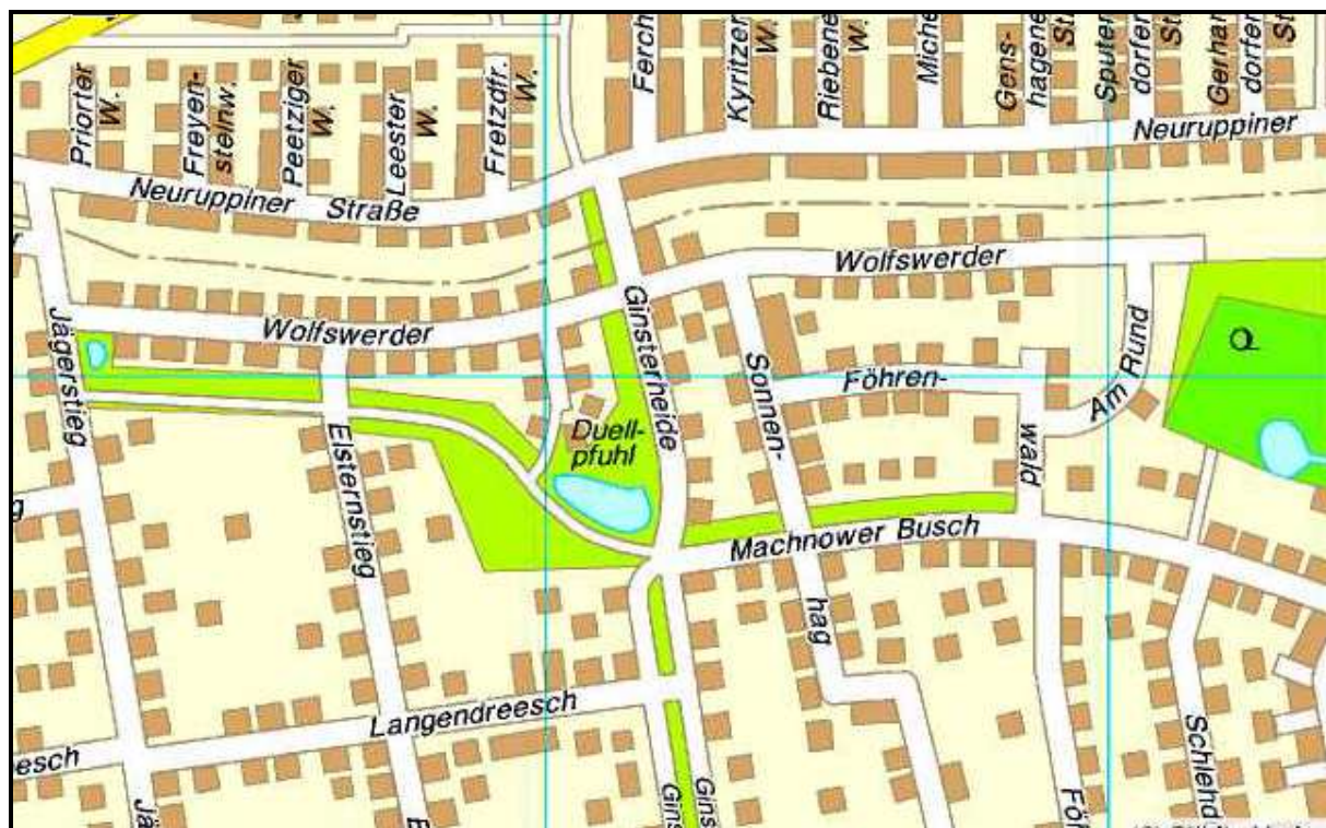
Abbildung 2: Lage des Duellpfuhls